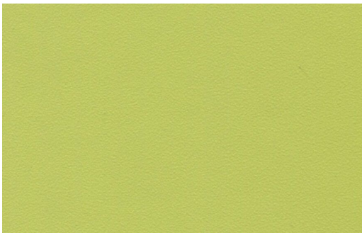
ACOUSTIC 43 UNI 7235-275