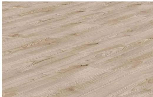
NOBLESSE D7091 ROVERE TICINO