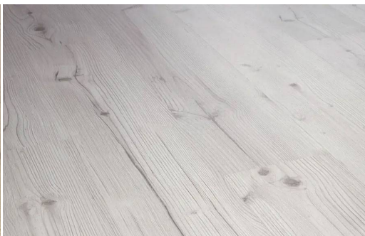
NOBLESSE D4941 PINO BISCAGLIA