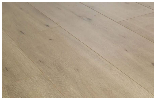
NOBLESSE D4660 ROVERE ARTISAN NATURALE