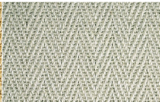
SISAL LOLKY 2060