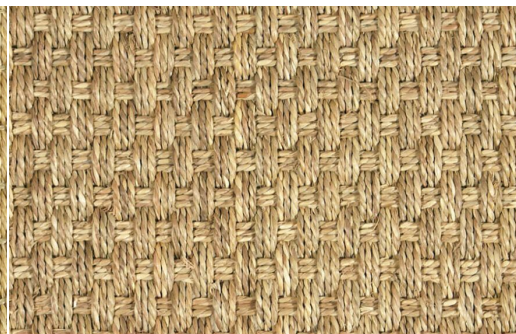
ALGA MARINA HILO