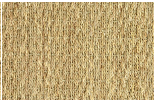
ALGA MARINA - MANILA