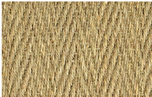
ALGA MARINA CHEVRON